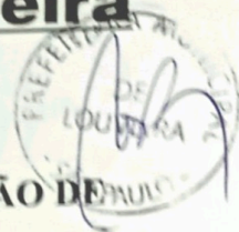
TABELA PARA COBRANÇA DA TAXA DE LICENÇA PARA OCUPAÇÃO DE ÁREAS EM VIAS E LOGRADOUROS PÚBLICOS.