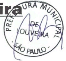
Tabela I Suplementações

Órgão: 01 Executivo Ficha: 27 Unidade: 01 Chefia do executivo SubUnidade: 02 Divisão da guarda municipal Função: 06 Segurança pública SubFunção: 181 Policiamento Programa: 0004 Segurança do município Proj. Ativ.: 2009 Direção e coordenação da guarda municipal