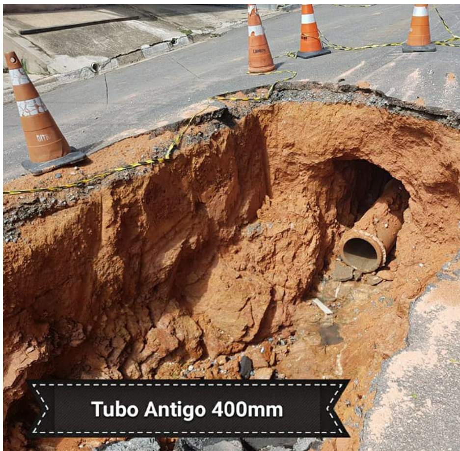
Tubo Antigo 400mm