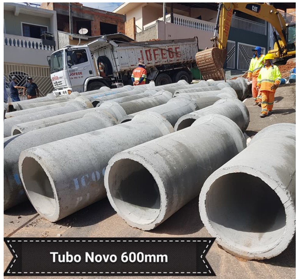
Tubo Novo 600mm