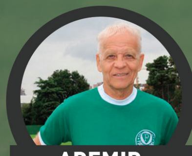
ADEMIR DA GUIA