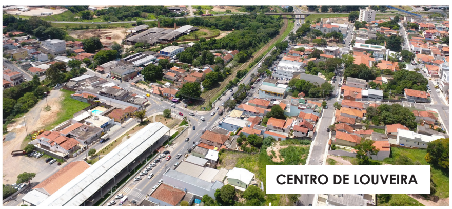
CENTRO DE LOUVEIRA