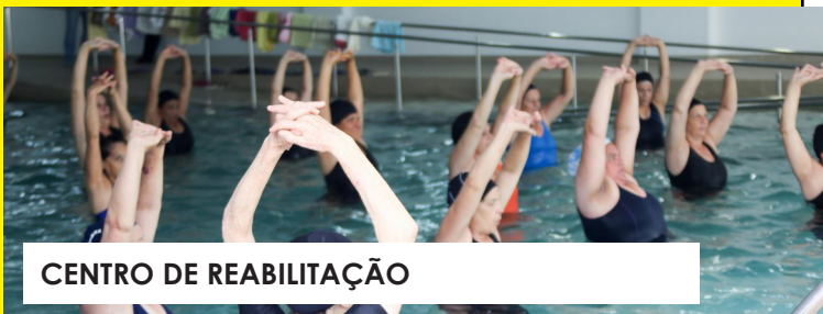
CENTRO DE REABILITAÇÃO

Além da eficiência na gestão, a Prefeitura investe bem acima do que é estabelecido. No ano de 2016, cerca de 25% do orçamento foi aplicado somente na Saúde, enquanto que o obrigatório é apenas 15%.