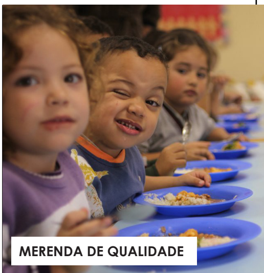
MERENDA DE QUALIDADE

Louveira já supera a meta estabelecida pelo Governo Federal na educação, que é atingir nota 6 no Ideb em 2022. Desde 2015 a rede municipal de ensino louveirense tem nota 7 no Índice de Desenvolvimento da Educação Básica (Ideb), que é o principal indicador de qualidade do ensino básico no Brasil.