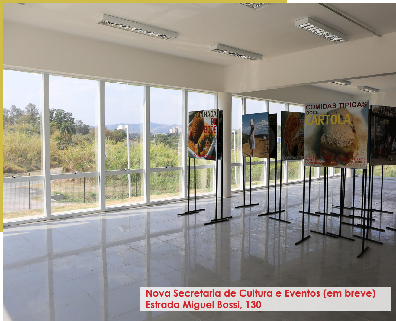
Nova Secretaria de Cultura e Eventos (em breve) Estrada Miguel Bossi, 130