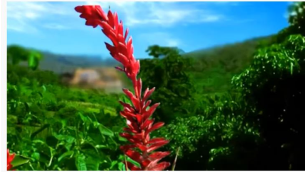
Palavra Cantada | Ora Bolas

Vamos Cantar com “Palavra Cantada”! No link abaixo, você poderá ouvir várias músicas e depois para continuar a brincadeira, que tal desenhar o que mais gostou delas.